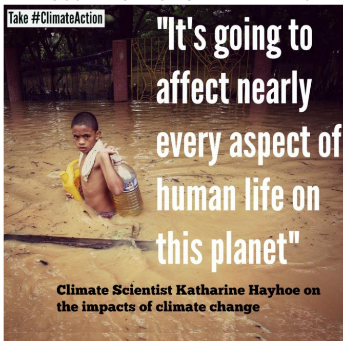
Podnebna znanstvenica Katharine Hayhoe o posledicah podnebnih sprememb: »Prizadele bodo vse vidike človeškega življenja na tem planetu!«

Poročili delovne skupine I in II, gledano skupaj, nakazujeta, da lahko zamudimo priložnost , da globalno segrevanje omejimo na 1,5 °C glede na pred-industrijsko raven. Le celovito, takojšnje ukrepanje nam lahko pomaga preprečiti ekstremen dvig globalne temperature za 2 ali več °C. Segrevanje do te mere bo v veliki meri katastrofalno, zato so tudi svetovne vlade prepoznale potrebo po omejitvi dviga temperature pod 2 °C.