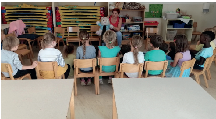
Slika 1: Obisk zajčka Belka in pripovedovanje zgodbe »Beli zajček«

Teden pred pričetkom igrice Beli zajček se je v času jutranjega kroga v skupino Kresničke zatekel zajček Belko (lutka). Vsakemu otroku posebej se je predstavil ter jih nežno pobožal po glavi. Skrbelo ga je, kako si bo lahko zapomnil toliko imen, a so ga otroci hitro potolažili, da ni nič narobe, če se kdaj zmoti. Hitro so opazili, da je Belko umazan, zato so ga začeli spraševati, kaj se mu je pripetilo. Zaupal jim je zgodbo, zakaj je pravzaprav prišel k njim (zgodba o belem Zajčku) ter jih prosil za pomoč. Otroci so mu obljubili, da mu bodo pomagali očistiti zrak tako v gozdu kot v bližnji okolici vrtca, in sicer tako, da bodo tudi sami v naslednjem tednu s starši v vrtec prihajali na čim bolj trajnosten način (peš, s kolesom, skirojem ali z avtobusom ...). Belko jih je nato povabil, da tudi sami ustvarijo svojega zajčka in mu tako kot njemu, pomagajo očistiti kožušček.