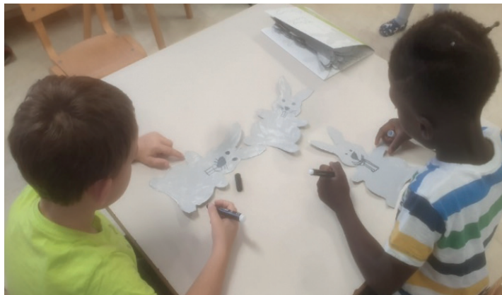
Slika 2: Ustvarjanje zajčkov

smrček, brčice in kremplje. Tako so bili zajčki pripravljeni na začetek igre. Da pa dolgouščki ne bi samevali na stenah, so otroci po zgodbi poustvarili tudi gozd, ki je skupaj z zajčki naslednji teden krasil igralnico.