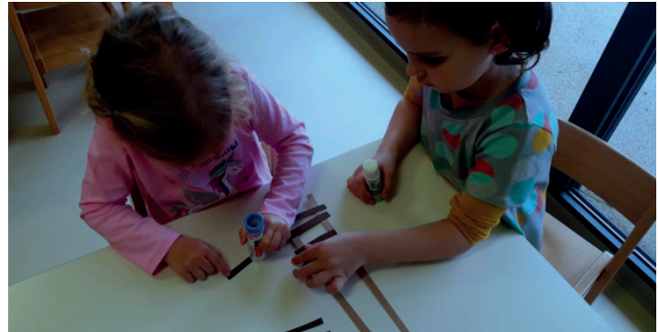
Na steni smo imeli slike različnih vlakov, ki smo jih kasneje otrokom ponudili kot sestavljanke. In naš končni izdelek...

Kasneje smo na steno igralnice nalepili različne slike vlakov in tirnic. Slike vlakov smo plastificirali in naredili sestavljanke iz sedmih oz. osmih delov. Večina otrok je potrebovala pri sestavljanju pomoč. Štirje otroci, so sestavili brez problema. Škatle zdravil smo uporabili za vagone vlaka, barvanje vagonov s tempero barvo in lepljenje tirnic.