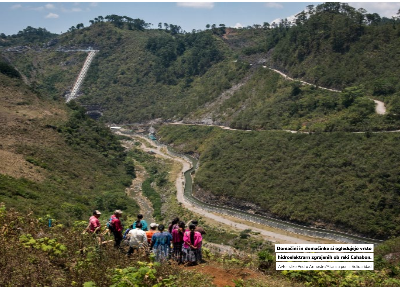
Domačini in domačinke si ogledujejo vrsto hidroelektrarn zgrajenih ob reki Cahabon.