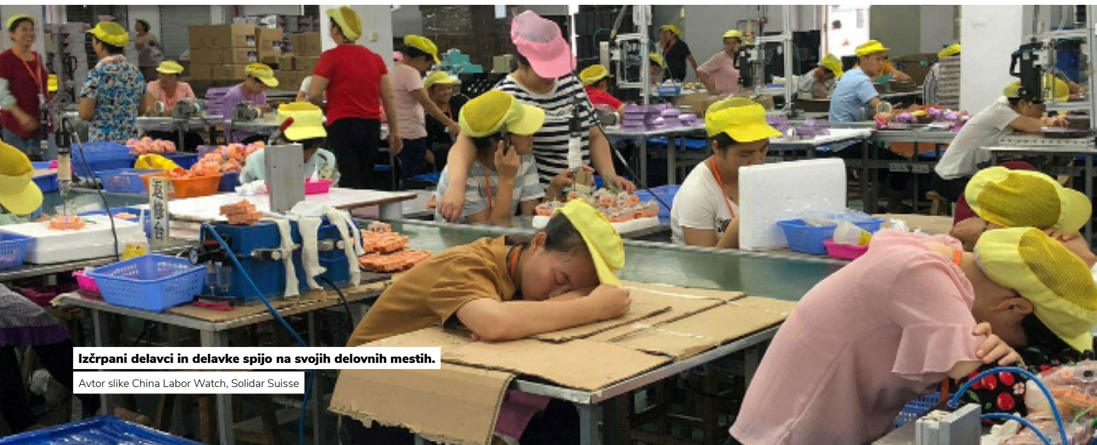
Izčrpani delavci in delavke spijo na svojih delovnih mestih.