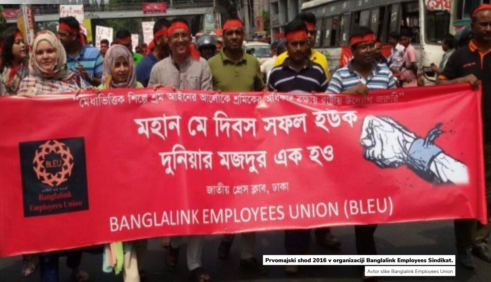
Prvomajski shod 2016 v organizaciji Banglalink Employees Sindikat.