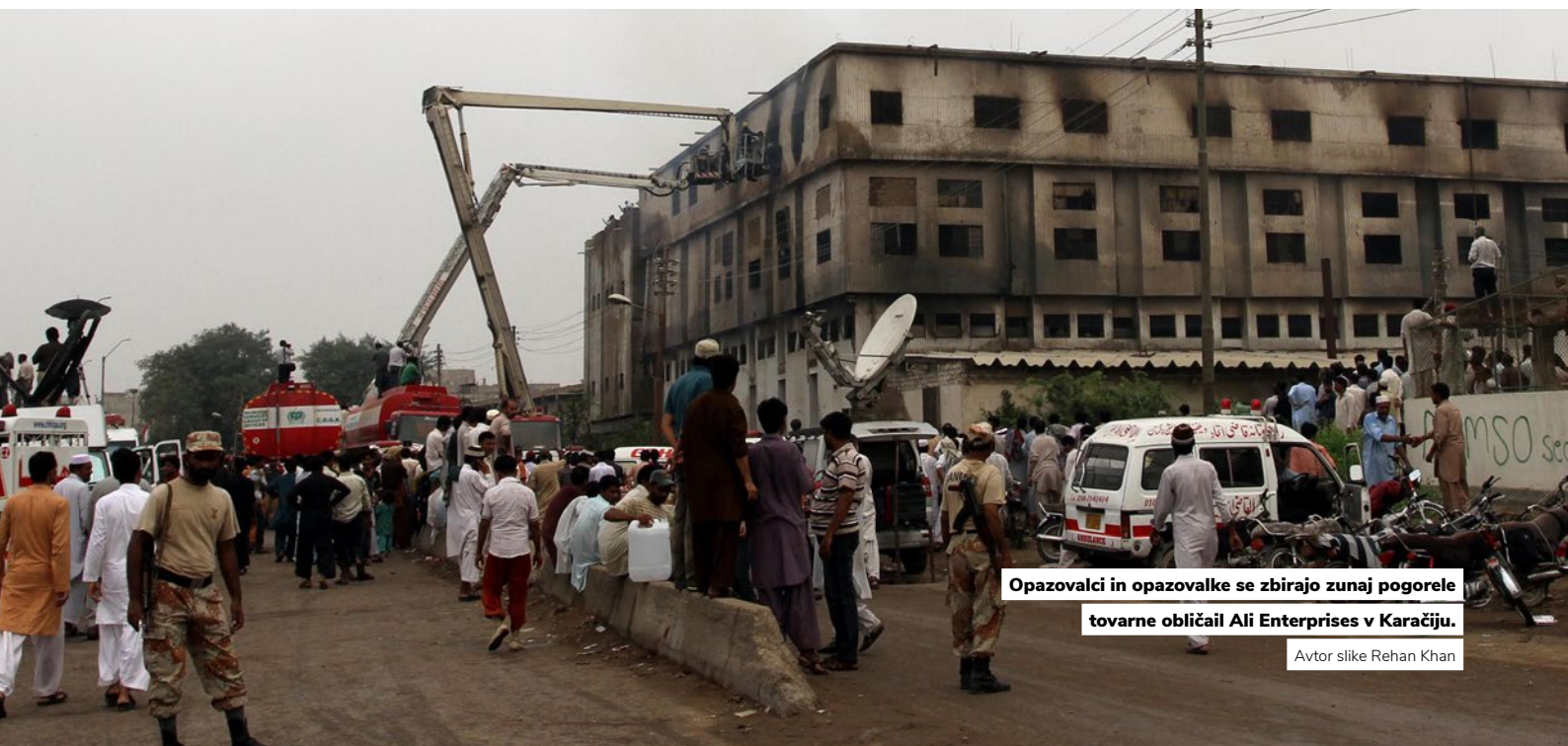
Opazovalci in opazovalke se zbirajo zunaj pogorele tovarne obličaj Ali Enterprises v Karačiju.