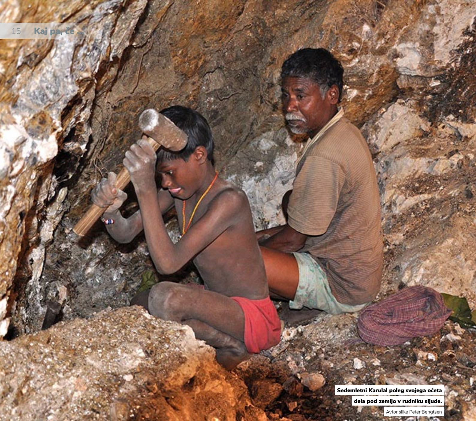
Sedemletni Karulal poleg svojega očeta