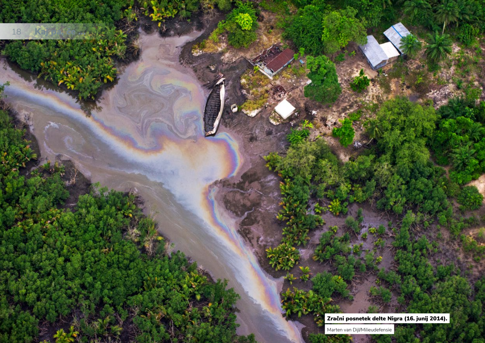
Zračni posnetek delte Nigra (16. junij 2014).